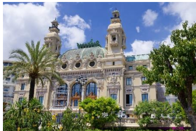
Teatro dell'Opera di Monte-Carlo