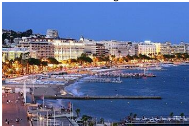
Croisette - Cannes