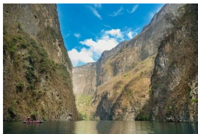
Canyon del Sumidero - Chiapas