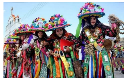
Comunità indigene di San Juan Chamula e Zinacantán