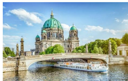
Crociera sul fiume Sprea

La Nona sinfonia è l'ultima opera completata da Gustav Mahler : è un addio espressivo e allo stesso tempo un'anticipazione visionaria del modernismo musicale. Il compositore però non poté completare le sue consuete revisioni finali sull'equilibrio strumentale. Per questo Kirill Petrenko afferma che "L'interpretazione di quest'opera rappresenta una sfida speciale per tutti coloro che interpretano questo testamento musicale". Sarà una grande occasione vederlo condurre i Berliner Philharmoniker , una delle orchestre più apprezzate a livello mondiale.