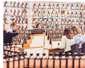
Museo dei profumi - Grasse