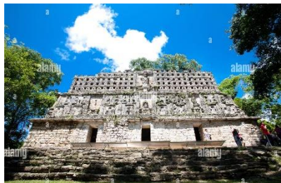
L’antica città Maya di Yaxchilán