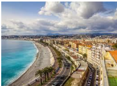
Promenade des Anglais - Nizza

Prendiamo l'occasione anche per trascorrere qualche giornata sulla costa alla scoperta dei suoi luoghi iconici: dall'elegante Monte Carlo con il Palazzo dei Grimaldi al capoluogo Nizza , città vivace unione di modernità e Belle Epoque; da Grasse , capitale mondiale della produzione di profumi alle mondane Cannes e Antibes e ai suggestivi borghi di Eze e Saint Paul de Vence .