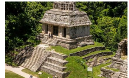
Zona archeologica di Palenque