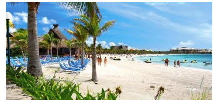
Barceló Maya Grand Resort