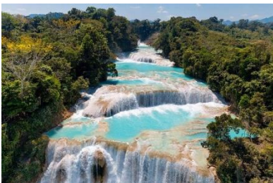
Cascate di Agua Azul