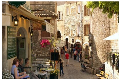
Saint Paul de Vence